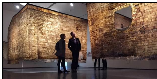
Slika 7. Proizvodi čišćenja kao eksponati izložbe

U praksi, ova teorija se primenjuje tako što se sve što se otklanja sa zidova, čuva i izlaže, jer se smatra da i oštećenja imaju gotovo ravnopravnu važnost kao i objekat restauracije. Platna koja nastaju kao proizvod čišćenja su poput zavesa i najefektniji način za njihovo izlaganje jeste omogućavanje pozadinskog osvetljenja. U projektu revitalizacije napuštene fabrike ribe, ovakve zavesе mogle bi da budu pogodno rešenje za izložbeni prostor. Izložbeni prostor svakako zahteva regulisanje prirodne svetlosti, a kada bi se na ovaj način zaklonili prozori, istovremeno bi se dobilo i funkcionalno rešenje i stalna umetnička postavka.