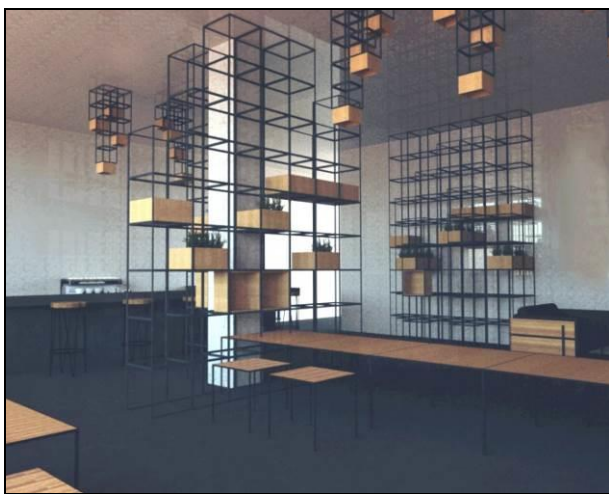
Slika 5. Enterijer kafe bara

Ideja za enterijer kafe bara vođena je teorijom da su i oštećenja podjednako bitna kao i objekat kom su ona naneta, koja će biti objašnjena u daljem tekstu. Predlog je da se prostor obnovi u meri koja je potrebna za ispunjenje standarda koji omogućavaju funkcionisanje kafe bara, a da deo oštećenja ostane vidljiv. Kako bi se ovo omogućilo, dizajnirani su elementi poput stubova od okvira armatura. Oni su postavljani oko i ispred delova koji ostaju u postojećem stanju. Ovi elementi su istovremeno upotrebljeni kao pregrade sa policama koje stvaraju mikroprostore.