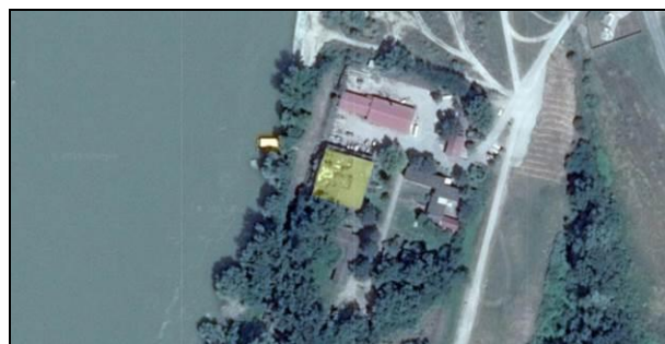
Slika 4. Lokacija

Objekat se nalazi na samoj obali Dunava, na periferiji naselja, okružen prirodom, te ima potencijal turističke lokacije. Apatin je naselje od davnina poznato po ribolovu, a i sam objekat je bio fabrika ribe, pa je predlog da se u prizemlju objekta nađe turističko-ugostiteljski prostor, odnosno kafe sa ponudom dostavljene i pripremljene sveže ribe.