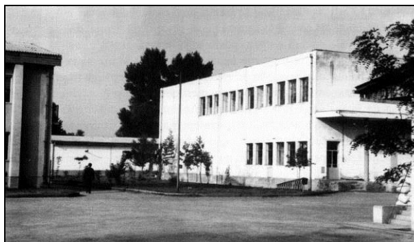
Slika 1. Zgrada ribolovnog centra

Prve veće investicije uložene su 1958. godine za izgradnju novog Ribolovnog centra čija izgradnja se završava 1960. godine.