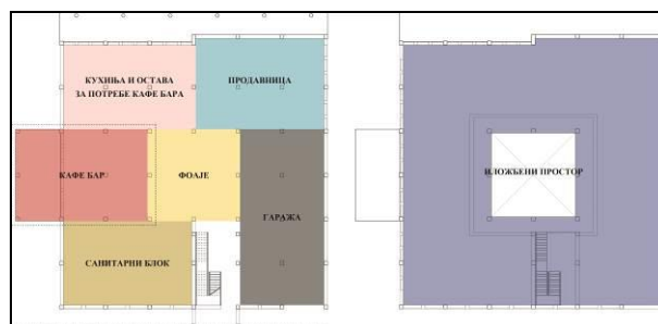
Slika 3. Šematski prikaz funkcionalnih zona revitalizacije

Iz sprovedene analize proizašao je stav da se u projektu revitalizacije pored arhitektonskog potencijala iskoristi i potencijal lokacije objekta kroz stvaranje višenamenske funkcije. Kako je ukupna površina ovog objekta preko dve hiljade kvadratnih metara, u daljem radu predlog revitalizacije za ceo objekat biće dat šematski i tekstualno, dok će deo namenjen kafe baru biti detaljnije rešen u tekstu i kroz tehničke priloge.