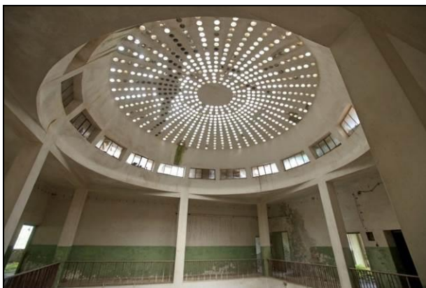
Slika 6. Kupola

Na nivou prvog sprata predlog je da se nađe isključivo izložbeni prostor, jer se na tom nivou nalazi galerija koja omogućava dobar pogled na kupolu objekta. Takođe, prostorije bi mogle da se povežu i na taj način omogućе kružno sagledavanje izložbe.