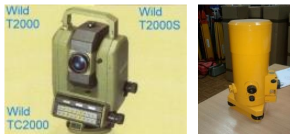
Slika 1. Korišćeni instrumenti

Ovaj rad proistekao je iz master rada čiji mentor je bio dr Zoran Sušić, docent.