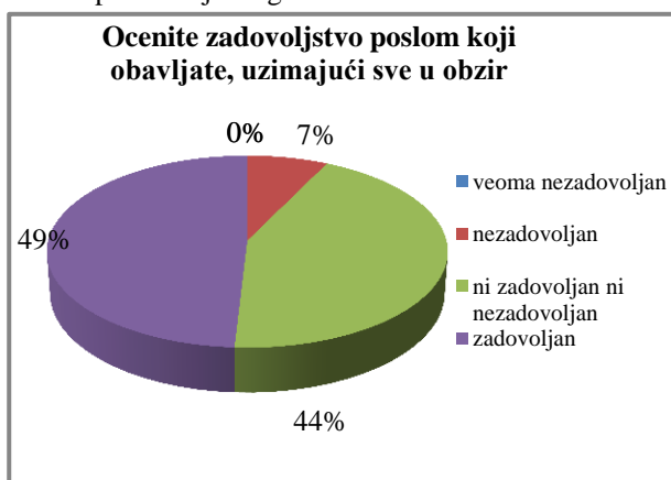
Grafikon 1 Zadovoljstvo poslom

Jedno od pitanja u kojem su zaposleni ocenili zadovoljstvo poslom, uzimajući u obzir sve prethodne analizirane faktore prikazan je na grafikonu 1.