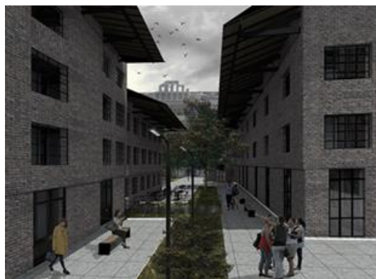
Slika 3. Eksterijer kompleksa

Iako se unutar kompleksa nalazi veliki broj srodnih ali u funkcionalnom smislu dosta različitih programa, oni su raspoređeni i usaglašeni tako da se razvijaju kao jedna celina. S obzirom da cela organizacija programa zavisi od posećenosti koja bi uticala na ekonomsku održivost celog projekta, neophodno je budući Umetnički centar posmatrati kao živ organizam koji se stalno menja u skladu sa tržištem i korisnicima, i ova karakteristika se nalazi u samoj srži koncepta revitalizacije.