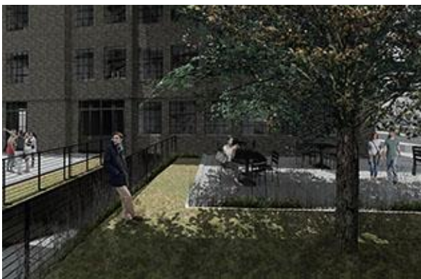
Slika 5. Umetnički centar kao socijalni i kulturni centar