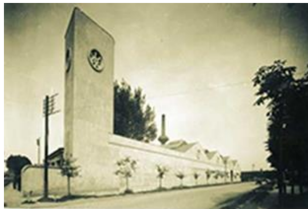
Slika 1. Prvobitni izgled kompleksa fabrike „Albus“

Posmatrano područje je sa stanovišta pristupačnosti I povezanosti sa ostalim delovima grada veoma povoljno, zbog blizine velike saobraćajnice, Bulevara Cara Lazara.