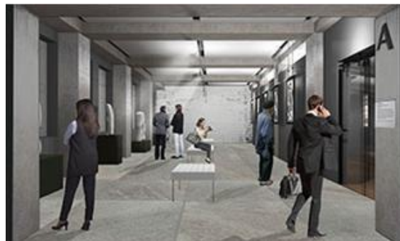
Slika 4. Enterijer galerije

Ovaj hibridni program, sačinjen od raznih funkcija i namena, zahteva odabir materijala koji ne bi narušavali originalnu ambijentalnost, i iziskuje dodatnu pažnju pri spajanju starih volumena sa novim strukturama.