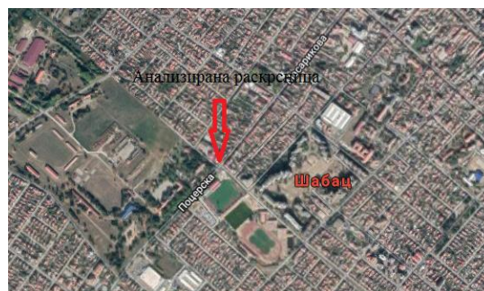
Slika 1. Položaj analizirane raskrsnice na uličnoj mreži grada Šapca

Raskrsnica koja je predmet ovog rada nalazi se u grada Šapcu. Ona je locirana na jednom od glavnih ulazno – izlaznih pravaca iz grada, pa samim tim predstavlja značajnu raskrsnicu u gradu. Pocerska ulica vezuje se za državni IB reda broj 26, koji predstavlja vezu Beograd – Obrenovac – Šabac – Loznica – državna granica sa Bosnom i Hercegovinom (Slika 1).