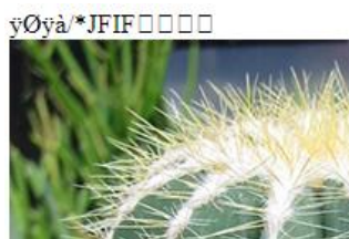
Slika 7. Višak teksta na vrhu prikaza

Ukoliko se ovako konstruisan poliglotski fajl prikaže u pretraživaču kao .html fajl, pri vrhu prikaza će biti vidljiv tekstualni višak koji potiče od zaglavlja slike (slika 7).