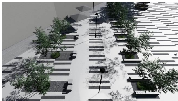
Slika 7. Ambijent

Naspram nje nalazi se jedna manja celina (slika 7.) koju karakteriše drveće niskog rasta postavljeno u dve paralelne linije. Ova celina predstavlja jedan mikro ambijent za socijalizaciju, koji je dodatno naglašen i odvojen od ostatka u vidu drugačijeg načina popločanja i trakastog podnog osvetljenja.