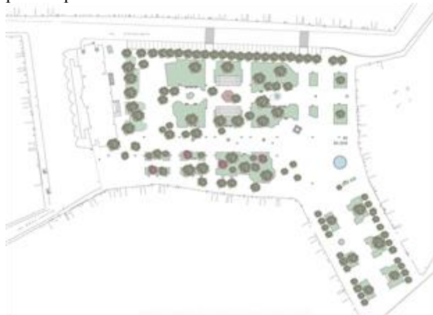
Slika 1. Plan postojećeg stanja

U postojećem stanju (Slika 1.) mogu se uočiti prednosti: lokacija trga, pristupačnost, velika površina, otvorena prizemlja i bogat program manifestacija. Problem kod ovog trga je to što je bezličan i ništa ne naglašava njegov identitet, nije prilagođen nameni, visokim krošnjama zaklonjene su vizure na objekte lepih fasada, sedenje je otuđeno, odnosno nema kolektivnih mesta socijalizacije, ne postoji javni toalet u čitavom gradu, a parking zauzima previše prostora.