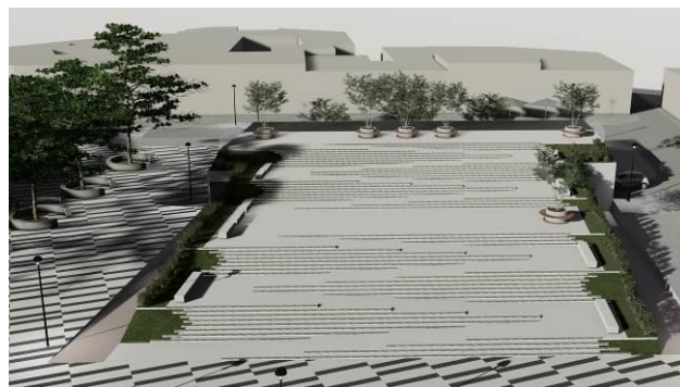
Slika 3. Platforma

ulice na severoistoku. Korisnici parkinga na površinu trga mogu izaći liftom koji vodi direktno do trga, ili stepenicama koje izlaze na pomenutu rampu sa južne strane platforme. Ispod najvišeg dela platforme isplaniran je prostor koji je namenjen potrebama gradskog muzeja.