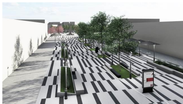
Slika 4. Jugoistočni segment

Jugoistočni segment trga (Slika 4.) karakterišu listopadne vrste drveća sa krošnjama koje nisu guste, ali stvaraju dovoljnu zaštitu od uticaja vetra i sunca. Organizovano je linijski u centralnom delu, tako da ne zaklanja fasade.