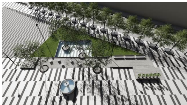
Slika 6. Severni deo trga

Centralni segment oko „Krsta“ (Slika 5.) nema parternog zelenila, jer je u tom delu potreban slobodan prostor za smeštanje ljudi i štandova u vreme manifestacija. Oko spomenika je isplanirano ukrasno crvenolisno drveće u skladu sa samim spomenikom koji je od crvenog mermera. Ova celina razlikuje se od ostatka i u načinu popločanja, koje dodatno naglašava spomenik.