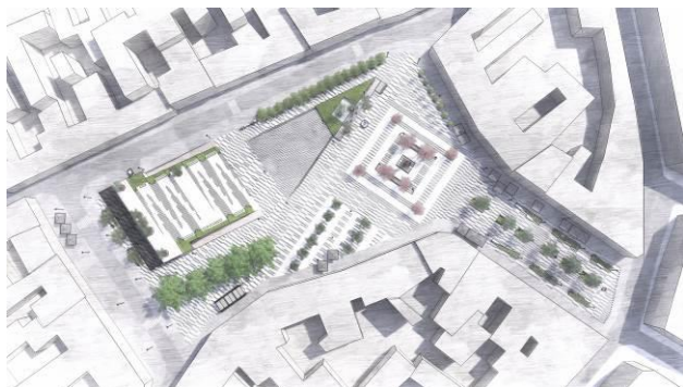
Slika 2. Plan novoprojektovanog rešenja

fasada, uvođenjem multifunkcionalne platforme, vodinih površina, popločanja, podnog linijskog osvetljenja, urbanog mobilijara i uličnog osvetljenja, one su međusobno estetski povezane i objedinjuju se u jedan prostor.