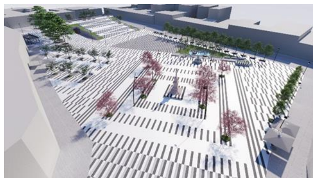
Slika 5. Centralni deo