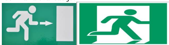
Slika 1. Oznake evakuacionih puteva

obuhvataju sve osobe koje u zgradi borave i gosti koji, nominalno mogu da se nađu u zgradi – objektu. Broj lica u objektu se određuje prema nominalnim kapacitetima pojedinih prostorija i uslova da se ostvari kretanje bez zagušivanja većeg od 3 lica/m 2 površine poda bilo gde na koridorima za evakuaciju.