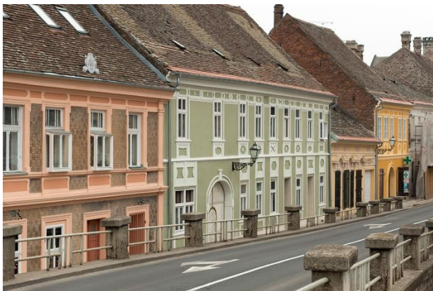
Slika 2. Karakteristični izgled fasada u Petrovaradinu

Prva i najznačajnija snaga prostorne celine koja je predmet ovog rada jeste lokacija na kojoj se nalazi. Pozicioniran na desnoj obali reke Dunav, pored međunarodnog puta i železničke pruge koji povezuju srednju sa jugoistočnom Evropom, Petrovaradin predstavlja jedinstvenu, demografski i geografski raznovrsnu celinu koja je na dovoljnoj udaljenosti od urbane sredine da ne bude ometana dinamikom razvoja Novog Sada kao gradske celine drugačijih karakteristika, a sa druge strane dovoljno blizu te iste urbane celine kako bi se održao tok razvoja i napretka različitih društvenih, ekonomskih i kulturoloških procesa.