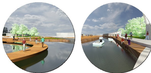
Илуст. 1. и 2: Приказ уређених површина поред воде

Уведене нове водене површине треба такође да постану нова мјеста социјализације и окупљања не само становника него и туриста који би боравили у овом насељу. На појединим дијеловима уведене водене површине моћи ће да се користе и за рекреацију и забаву на води. Водене површине треба да буду искориштене и за побољшање микроклиме јер она утиче на смањење температуре и повећање влажности што је изразито битно у току љетњих дана. Оваквим интервенцијама подигао би се ниво еколошке свијести и одрживости јер се становници на индиректан начин едукују за усвајање одрживог начина живота.