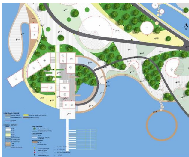
Слика 2: Кајак и кану клуб са околним смјештајним и угоститељским капацитетима, П 1:500

За стабла која се налазе на поплочаним површинама обезбијеђена је адекватна заштита од различитих врста оштећења у виду металних решетки, које омогућавају биљци довољно свјетлости, топлоте и влаге а људима неометано кретање.