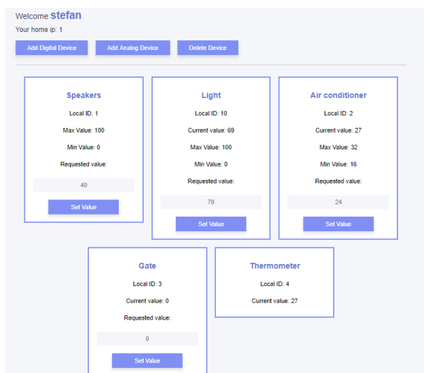
Slika 2. index.html forma

Kako HTML definiše strukturu i sadržaj stranice tako CSS određuje kako će sadržaj biti prikazan. CSS može definisati boju, veličinu, pozadinu, granice i mnoge druge attribute HTML elemenata, takođe dozvoljava nasleđivanje i prenošenje osobina između HTML elemenata. CSS je dizajniran sa namereom da se razdvoje način prezentovanja i sadržaj, dok se pre pojave CSS-a sve nalazilo u HTML formi. Odvajanje načina prezentovanja od sadržaja pruža veću fleksibilnost i kontrolu nad određenim specifikacijama prezentovanja.