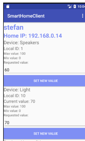
Slika 3. Prikaz uređaja u Android aplikaciji

Aplikacija se sastoji od samo jedne aktivnosti i prilikom aktiviranja prikazuje prozor za prijavljivanje korisnika. Nakon uspešnog prijavljivanja korisnika, prozor za prijavljivanje se sakriva i otkriva se prozor sa listom uređaja (slika 3).