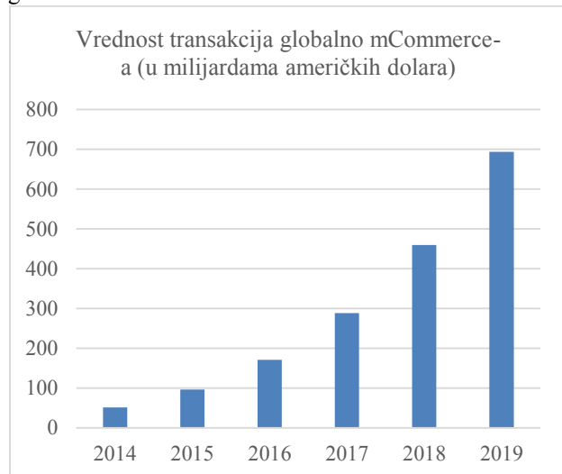
Grafik 1. Vrednost transakcija m Commercea u svetu

Mobilna trgovina se odnosi na vođenje e-trgovine putem bežičnih uređaja. Aplikacije za mobilnu trgovinu omogućavaju kupovinu različitih roba i usluga, realizaciju bankovnih transakcija i pristup plaćenim sadržajima i informacijama. Bežične tehnologije u sledećim oblastima e-trgovine imaju značajan uticaj i stvaraju novu vrednost: integracija lanca ponuda, upravljanje transportom, upravljanje odnosima sa korisnicima i automatizacija prodaje. [7] Na interesovanje za mobilnu trgovinu, pored izgleda da se poveća broj korisnika i mogućnosti jeftinog internet pristupa, utiču i sledeće karakteristike: mobilnost, dostupnost, pogodnost i lokalizacija proizvoda i servisa. Mobilnost je omogućena mobilnim uređajima koji korisnicima nude informacije sa bilo koje lokacije. Zahvaljujući mobilnim uređajima korisnici mogu da odmah reaguju na svaki kupovni impuls. Po statističkim podacima, mCommerce je najbrže rastuća niša kada je online prodaja u pitanju. U 2019. godini se očekuje porast globalne prodaje u iznosu od 1362% u odnosu na 2014. godinu