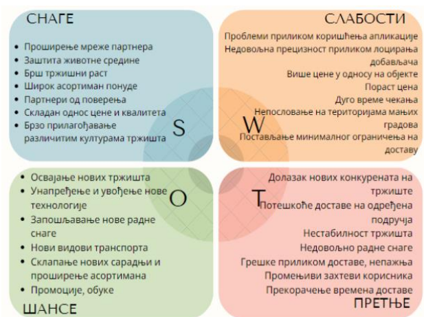
Slika 1: SWOT analiza