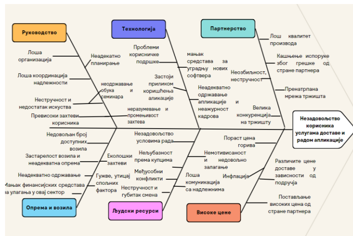
Slika 3: Ishikawa dijagram glovo kompanije

Proces izrade dijagrama uzrok-posledica prema primeru poslovanja kompanije Glovo, zasnivao se na grupisanju pojedinačnih problema, u jedan glavni. Glavni problem razvijen je na osnovu dobijenih rezultata od strane ispitanih korisnika i potrošača ove kompanije, i njihovih negativnih ocena po pitanju nezadovoljstva poslovanja unutar kompanije, u cilju stvaranja prostora za dalju izradu i predlaganje mera unapređenja.