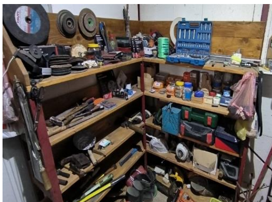
Slika 2: 5S - Organizovanje (stanje pre) - Police

Police za alat, boje, lakove i lepak su bile potpuno neorganizovane i prljave što je prikazano na slici 2.