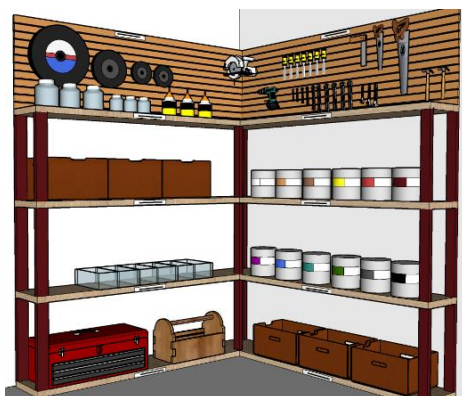
Slika 3: 5S - Organizovanje (stanje posle) - Police

Zbog ograničenog vremena boravka u radionici, organizovanje policia nije moglo odmah biti realizovano. S toga je za vlasnika radionice pripremljen grafički prikaz, odnosno 3D model koji je urađen u programu Sketchup i koji predstavlja predlog za organizovanje i uređenje policia.