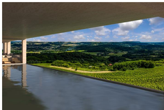
Slika 1: Pogled na vinograde sa terase vile

Lokacija odabrana za razvijanje projekta luksuzne vile nalazi se u Italiji, u blizini malog gradića Pian di Rocca u regiji Toskane. Lokacija je udaljena od drugih objekata kako bi se postigao zahtijevani mir i jedna vrsta izolacije od svakodnevnog života. Nalazi se na vrhu brežuljka, dok se ispod nje prostiru vinogradi. U sklopu parternog uređenja, prostor ispred vile je zamišljen da se preuredi u parkovski prostor. Do objekta je planirana nova saobraćajnica kako bi se do vile moglo pristupiti automobilom. Sa zadnje strane vile nalazi se terasa sa koje se pruža prelijepi pogled na okolnu prirodu.