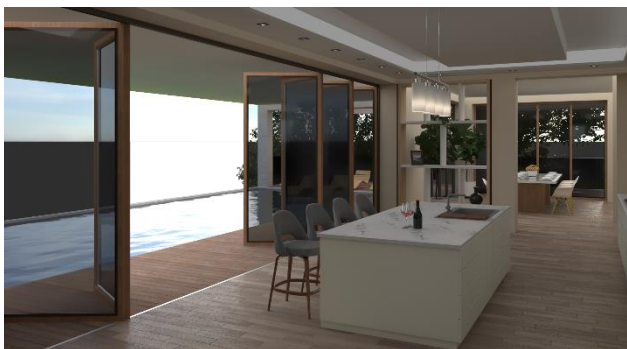
Slika 2: Prikaz enterijer kuhinje

Podrum i sprat nisu tako fluidni kao prizemlje iz razloga što imaju jasno definisanu funkciju koja je dosta privatnijeg karaktera u odnosu na sadržaje u prizemlju. Prirodni tonovi u prostoru omogućavaju bolji doživljaj spoljašnjeg prostora. Takođe, prirodni materijali pozitivno utiču na zdravlje ljudi.