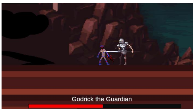
Slika 1: Protagonista sa jednim od boseva

Tokom borbe sa bosevima se na dnu ekrana nalazi naziv njihov health bar i njihovo ime, kao na Slici 1 jer je tako predloženo u [8]. Ime služi na naglasi njihov značaj, a health bar im funkcioniše isto kao sa igračevim, osim što je ovde popunjenost sve vreme crvene boje.