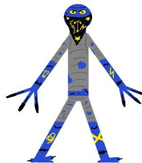
Slika 2: Jedan od modela protagoniste

Prateći [12] odeća protagnosite je sive boje, pošto on ipak jeste deo ovog mračnog sveta a i ima mračniju stranu u sebi koju treba da koristi kako bih mogao da izvrši svoj zadatak. Njegov šal je crne boje i namerno je to manji deo odeće jer se time ipak ističe da je ta mračna strana mali deo njega i da može on da je na kraju savlada i ne padnje u iskušenje. Boja kože mu je plava jer ona predstavlja nadu.