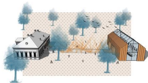
Slika 2. 3D prikaz Stari i novi dvorac

povezanost ispod nivoa terena, odnosno ukopavanjem novog sadržaja. Novi objekat zadržava gabarite postojećeg dvorca, ali se prostorna organizacija razlikuje (slika 2). Zbog bolje iskorišćenosti prostora, se umesto četvorovodnog krova formira dvovodni krov. Takođe visoko prizemlje se spušta na nivo terena, da bi se dobila veća visina prostora, što je kasnije dovelo do dodatnog prostora ispod krovne konstrukcije, koji je doprineo formiranju još jednom od saržaja unutar objekta. Podrumska etaža se nalazi ispod celokupne površine objekta, koja je kao što je već rečeno, uz stvaranje novog prostora "pasarele", spojena sa postojećim dvorcem.