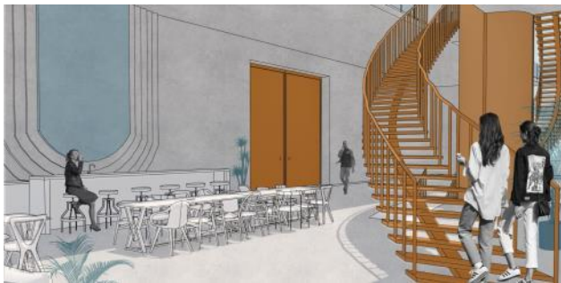
Slika 4. Dvorac Bezeredi-Dundžerski_Ambijent prizemne etaže

Najveći deo privatnog sadržaja nalazi se na prvom spratu, gde su smeštene stambene jedinice. Tu se nalaze tri tipa jedinica/soba, za jednu ili dve osobe. Svaka soba poseduje sopstvenu galeriju ispod krovne konstrukcije. Toaleti i tuševi su zajednički, i podeljeni su na muški i ženski. Na ovaj način je povećan broj smeštajnih kapaciteta objekta, ali i olakšano održavanje. U prizemlju se nalaze kuhinja i trpezarija kao delimično privatni sadržaj. Kuhinja je preko manjeg lifta spojena sa podrumom gde se nalazi skladište za svu potrebnu robu. Ovo jeste mesto koje je predviđeno za socijalizaciju, ali ne mora nužno da bude. Na dva kraja objekta nalaze se dve kuhinje (slika 4).