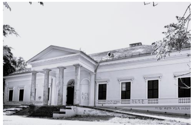
Slika 1. Dvorac Bezeredi-Dunderski, Čelarevo