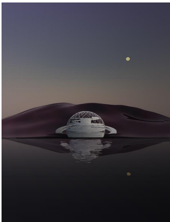
Slika 1. konceptualni 3D prikaz

Klub, kao glavna bina u predstavi čovekovog iskustva, smešten je upravo u sferičnu konstrukciju, kao simbola koji prevazilazi materijalni svet, odražavajući složene aspekte ljudskog iskustva i univerzalne istine. Stvara se i energetski hibrid između ovog organskog i javnog sadržaja, siamski ambijent za biljni i ljudski život i bar u trenutku je rastući problem energije budućnosti zadovoljen.