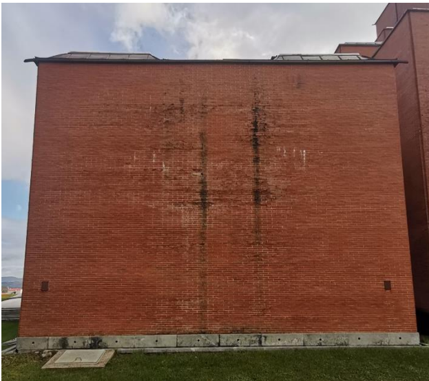
Slika 3. Oštećenja na kulama muzeja