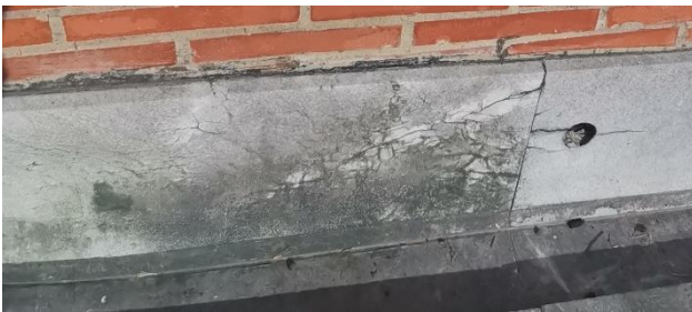
Slika 4. Ispucala površina sokle sa biološkom korozijom

Na severozapadnoj fasadi je uočeno odvajanje mermerne ploče od armirano-betonske podloge, ovo oštećenje prikazano je na slici 5.