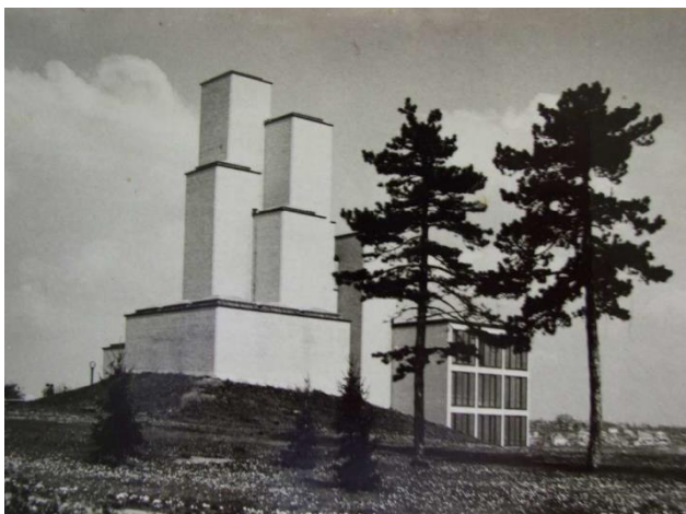
Slika 1. Prva fotografija muzeja „21. oktobar“ [4]

Spomen-park „Kragujevački oktobar“ osnovan je 1953. godine na prostoru gde je 21. oktobra 1941. godine streljano više hiljada građana Kragujevca – u najvećem broju Srba, Jevreja, Roma, ali i Slovenaca i pripadnika drugih nacionalnosti. Takođe, čuva uspomenu na 415 ljudi iz okolnih sela, ubijenih 19. oktobra i njih 123, stradalih 20. oktobra. Na slici 1 je prikazan izgled muzeja iz početnog perioda.