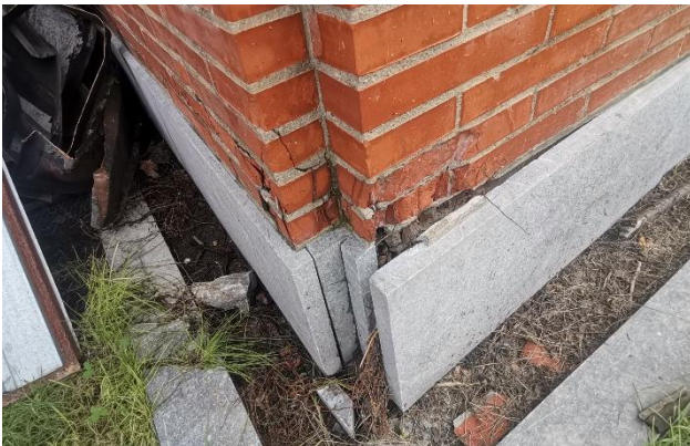
Slika 5. Odvajanje sokle

Na severozapadnoj fasadi je uočeno odvajanje mermerne ploče od armirano-betonske podloge, ovo oštećenje prikazano je na slici 5.