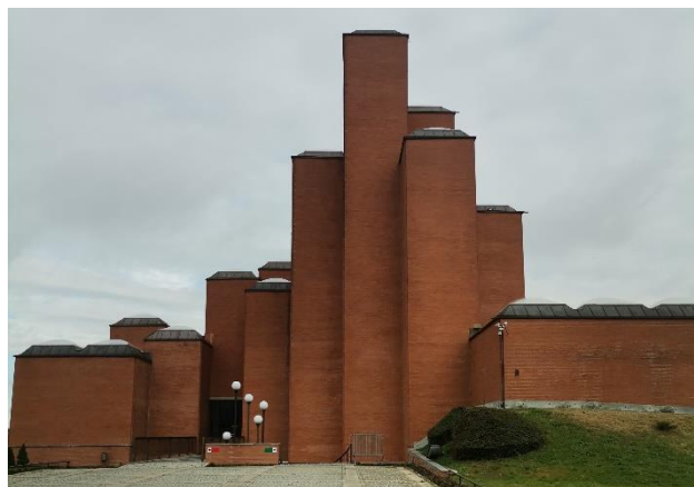
Slika 2. Jugozapadna fasada objekta

različitih visina (od 4m do 23,5m). Spratna visina se kreće od 2,87m do 17,90m. Na slici 2 je prikazana jugozapadna fasada objekta.