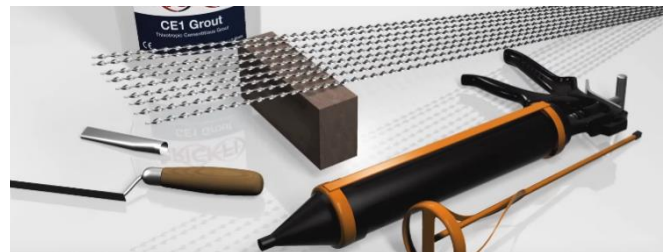
Slika 5. Potrebna oprema za izvođenje sanacije [5]

Na slici 5 prikazana je potrebna oprema kako bi se izvršila sanacija.