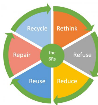
Slika 1. Grafički prikaz cirkularne ekonomije kroz koncept 6R

Recycle – Reciklaža i ponovno vraćanje materijala i sirovina u tokove proizvodnje.