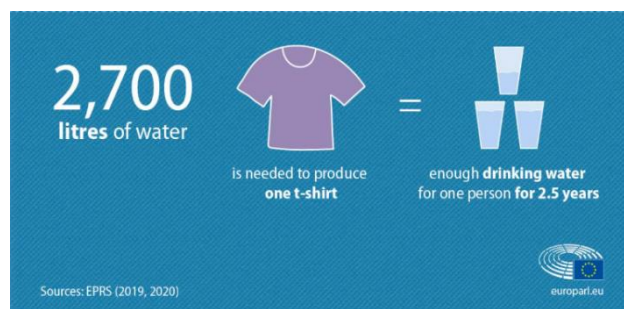
Slika 2. Grafički prikaz potrošnje vode za proizvodnju jedne majice

Rezultati proizvodnje odeće imaju svoje efekte na životnu sredinu – 20% svih zagađenih industrijskih voda dolazi iz proizvodnje ili obrade tekstilnih proizvoda, a procenjeno je da godišnje pola miliona tona plastičnih mikrovlakana koje se osipaju tokom pranja odevnih tekstila kao što su poliester, najlon ili akril završe u okeanu [3].