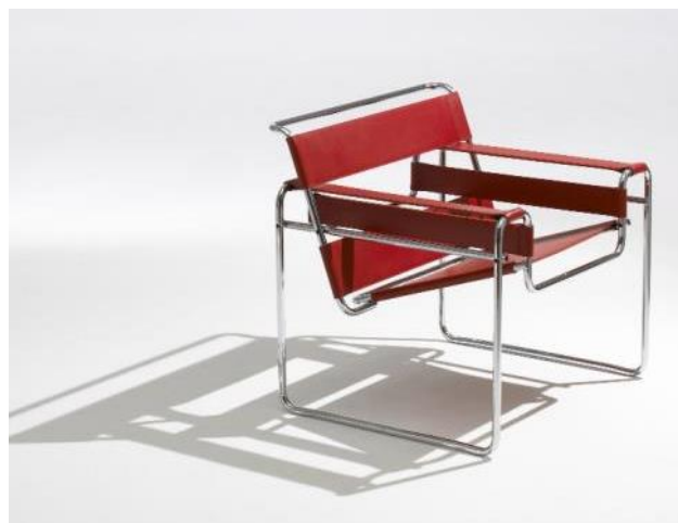
Слика 4: „Marcel Breuer / Wassily chair“

Двадесети вијек карактерисала је разноврсност стилова. Први изузетан био је Баухаус, настао из Баухаус школе, коју је основао Валтер Гропијус у Вајмару 1919. године. Овај стил је био познат по свом функционалном и модерном дизајну. Дао је приоритет функцији, одбацујући непотребне стилске наклоности [3].