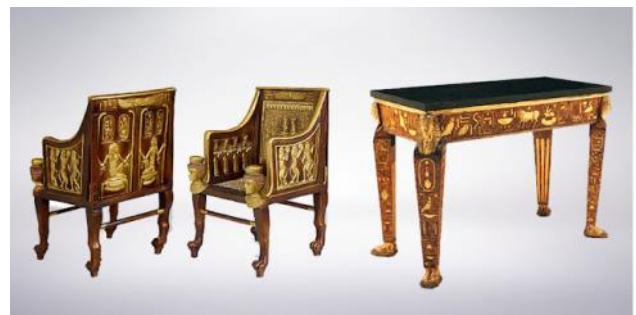
Слика 1: намјештај из старог Египта

Један од првих примјера дизајна намјештаја у историји био је намјештај старог Египта. У то вријеме намјештај је био луксуз доступан само богатима, а да буде симбол моћи била је његова примарна функција. Најчешћи материјали коришћени за израду намјештаја у том периоду били су дрво, слоновача и злато, а одликовали су га квадратни облици. Циљ истраживања је идентификација проблема у вези са инсолацијом и смањење осунчаности на дечијем игралишту, спроводећи соларне анализе употребом различитих софтвера. Важно је осигурати да дечија игралишта пружају сигурно и пријатно окружење за игру и забаву током целе године, а истраживање прекомерне осунчаности и побољшање спољашњег термалног комфора може помоћи у остваривању таквог циља [1].