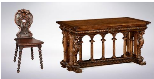
Слика 2: намјештај из периода ренесансе

Касније, ренесанса се шири Европом и велики утицај класичног периода одређује даљи пут развоја дизајна намјештаја. Било је то вријеме значајних умјетничких и научних остварења, у којима су поникли многи велики умјетници. Захваљујући трговини богатством која је донијета у Италију, људи су могли да приуште боље и веће становање, што је резултирало повећањем потражње за висококвалитетним намјештајем. Италијански дизајн је био типично правоугаони са уклесаним основама, а орнаментике су чинили архитектонски елементи и митолошке и историјске личности. Брзо се проширио на друге земље, али је почео да се мијења како су људи покушавали да га прилагоде локалном укусу [2].