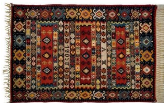
Слика 8: Пиротски ћилим са Кондићевом шаром

Главна одлика јесте што пиротски ћилим нема наличје, већ два лица у потпуности иста, што нигдје друго у свијету није забиљежен случај. Израђује се искључиво од квалитетне вуне, која је била у изобиљу на Старој планини у прошлим временима [9].