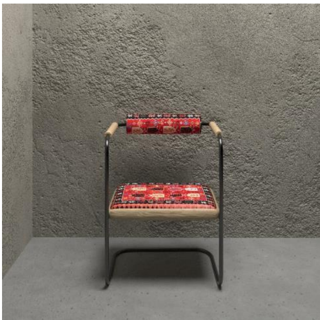
Слика 9: Визуализација E chair Pirot