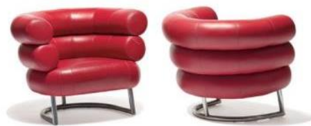
Слика 5: „Eileen Gray / Bibendum Chair“

Двадесетих година прошлог вијека у Паризу се појавио чувени Арт Деко, умјетнички покрет који карактеришу углађене геометријске или стилизоване форме које користе вјештачке материјале. За разлику од Баухауса, Арт Деко је славио луксуз и софистицираност.