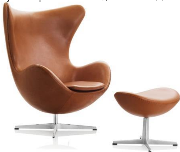
Слика 6: „Arne Jacobsen / Egg Chair“

Један од кључних утицаја на модеран дизајн средином прошлог вијека био је скандинавски дизајнерски покрет. Дизајнери из земаља као што су Данска, Шведска и Финска, укључујући Арнеа Јакобсена, Ханса Вегнера и Алвара Алта, стекли су међународно признање за своје иновативне и ванвременске дизајне. Скандинавски дизајн је нагласио једноставност, функционалност и снажну повезаност са природом. Чисте линије и органски облици били су централни дио модерног намјештаја из средине вијека. Дизајнери су имали за циљ да створе комаде који су и естетски пријатни и практични за свакодневни живот. [5]