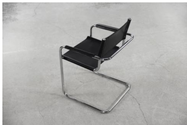
Слика 7: „Marcel Breuer / Cantilever Chair“

Сваки комад намјештаја се може сматрати минималистичким све док се фокусира на коришћење сирове функције без сувишних облика. Идеја је намјештај који служи својој сврси [4].