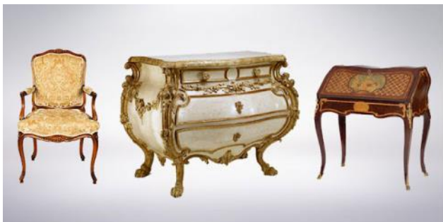
Слика 3: намјештај у рококо стилу

Током 18. и 19. вијека настала су још два добро позната стила: бујни нови рококо стил, са густим орнаментима и пастелним бојама, и сецесија, позната по својим линијама и облицима. За намјештај из осамнаестог вијека се обично мисли да представља златно доба високо обучених мајстора столара, обучених у занату израде намјештаја, који се манифестује у високо завршеним, софистицираним дизајном. Рококо намјештај је раскошан и екстремног дизајна и често примјењује много различитих врста материјала и украса у једном комаду [1].