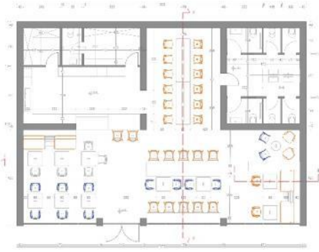
Слика 6: Новопројектовано стање са мобилијаром