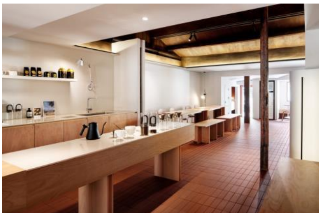
Слика 1: кафе PONT

ненаметљиву позицију осталог мобилијара, утиче на ефекат текућег простора читавом дужином.