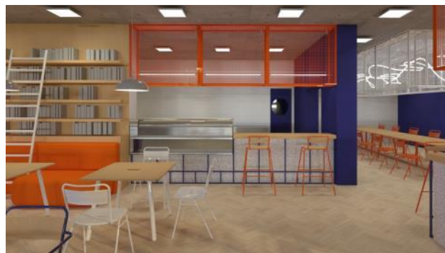
Слика 5: Рендер кафе-књижаре

Намештај за седење интезивно наранџасте тканине, постављен је уз зидове обложене дрвеном облогом и полицама истог материјала, визуелно подстиче кориснике да уоче библиотеку и искористе доступност понуде књига приликом посете.