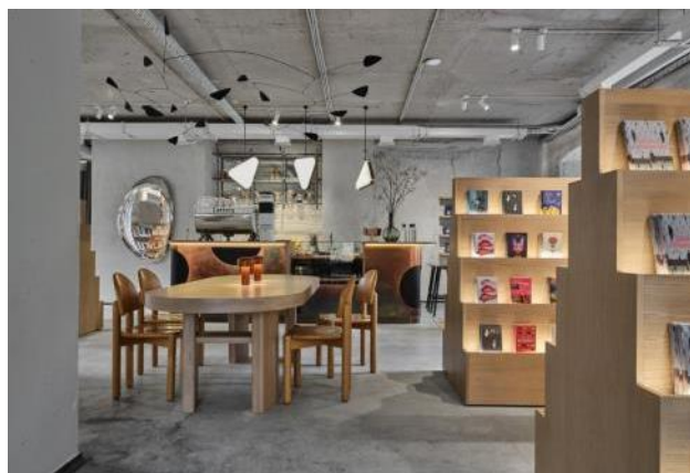
Слика 3: кафе-књижара Пољандрија

ношћу дрвета, попут степенстих самостојећих полица, столица скандинавског брэнда и великог стола који постаје централни мотив, чиме дизајнер успева да добије резултат топлијег ентеријера и створи удобни амбијент корисницима простора. Архитекта велику пажњу посвећује осветљењу, при чему је приметна велика количина природног светла, која овај простор чини додатно пространим и прозачним, иако је диспозицијом мобилијара и одсуством преградних зидова тај ефекат већ постигнут. Суптилно и топло вештачко осветљење доприноси комфору ентеријера.