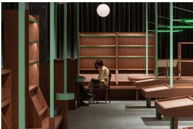
Слика 2: књижара Common Reader

Њихов дизајн, као и комбинација тамног дрвета и светло зелених детаља подсећа на изглед старих библиотека, чија атмосфера подстиче на рад и учење. Осим средишњег простора испуњеног столовима и столицама намењеним за читаоце, сегменти између полица пројектовани су за исту намену, али за кориснике којима је комфор приликом читања на првом месту.