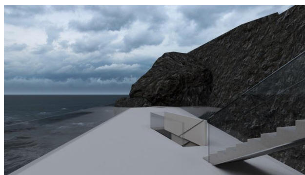
Слика 3: Поглед са крова

Објекат је постављен на западној обали острва Ланзароте, на плажи у близини села Ел Голфо. Како обалом владају оштре и стрме вулканске стене, позиција куће користи малу увалу за укљештење. Кући се приступа са главног пута колским саобраћајем, и воденим саобраћајем са плаже. Издигнута је пет метара изнад нивоа терена, што поред затворене форме штити објекат од осциловања водостаја Атлантског океана. Оријентација главне фасаде је југозападна ка океану, што одговара умереној клими која влада у подручју острва током целе године.