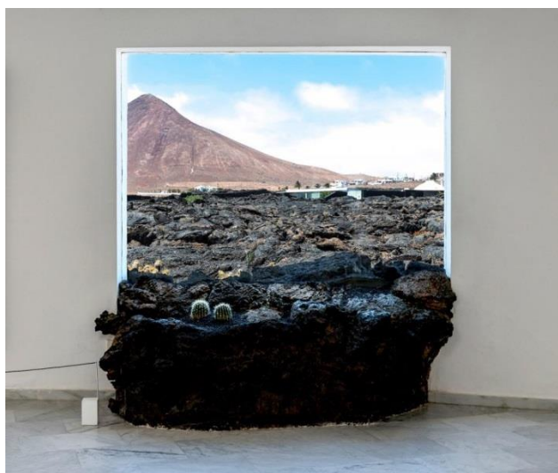
Слика 1: Студио архитектке Цесара Манрикеа

Преко ових простора изградио је ниво једноставних, белих традиционалних волумена - за разлику од тамног вулканског камена - кроз који пролазе светларници који преплављују подземне галерије светлом. Манрике је плодно градио на острву, укључујући шест центара уметности, културе и туризма (Jardín de Cactus је био његов последњи завршен пројекат, отворен 1991.), уметникову кућу-музеј и разне jugetes del viento („играчке од ветра“) расути по острву [2].