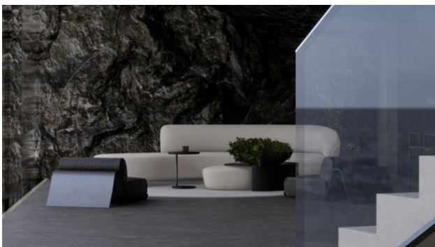
Слика 5: Амбијентални приказ

До купатила се долази кроз портал у издубљеној стени која је видљива и благо обрађена у његовој унутрашњости. Купатило такође има зенитално осветљење у крову – мотив који је такође преузет из Манрикеових дела. Намештај у дневној зони је изабран тако да уноси контраст у тамном и „хладном“ ентеријеру (Слика 5: Амбијентални приказ). Равнотежа се постиже комбинацијом глатких и грубих материјала, обрађеног и необрађеног камена, црних и белих тонова, као и закривљених форми мобилијара наспрам равних линија које преовладавају у остатку простора. Ефекат ритма постиже се са мермерном плочом у трпезарији, која се надовезује на концепт паралелних белих равни у архитектури. Кревет је делимично издвојен у зони за спавање и заклоњен од остатка простора зеленилом. Кухинјски елементи су уклопљени у једно централно острво и шанк сто. Како би се задржао линеаран и обједињен ефекат у простору, расвета у виду лед трака неприметно је постављена по ободу плафона и пода. У остатку простора где је неопходно интимније осветљење посрављене су подне и стоне лампе у топло белом тону.