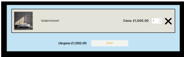
Slika 3. Prikaz korpe u Prestashop-u

Detalji o izabranom nameštaju prikazuju se na stranici koja je prikazana na slici 2. Na toj stranici korisnik može da vidi slike, opis, naziv, cenu nameštaja kao i ocene i komentare drugih korisnika veb aplikacije.