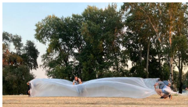
Slika 2 - Izvođenje performansa na stanici Lavirint od cevi