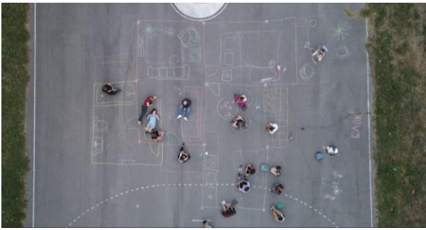
Slika 3 - Izvođenje performansa na stanici Blok2