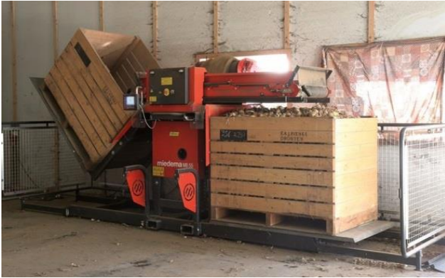
Slika 4. Prikaz DEWULF MB 55 mašine