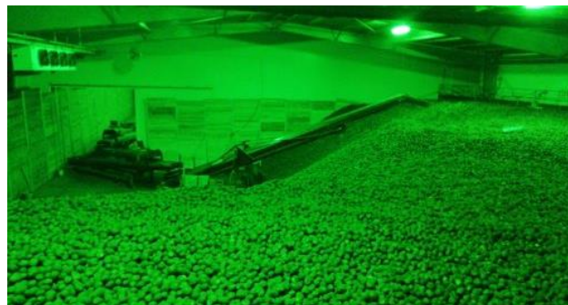
Slika 3. Prikaz trakastog transportera za skladištenje krompira unutar magacina

Kada je reč o opremi i transportnim sredstvima kompanije, ona poseduje mašine za istovar krompira, međutim sama transportna sredstva koja su potrebna za prevoz krompira od njive do pogona za istovar i preradu krompira ne poseduju, te kada je sezona vađenja krompira kompanija koristi usluge eksternih prevoznika koji se bave transportom voća, povrća i žitarica. Skladištenje unutar skladišta vrši se putem velikog broja trakastih transportera koje kompanija poseduje i koji su povezani direktno za liniju za prebiranje krompira i koji vode do skladišta, što će biti prikazano na slici 3.