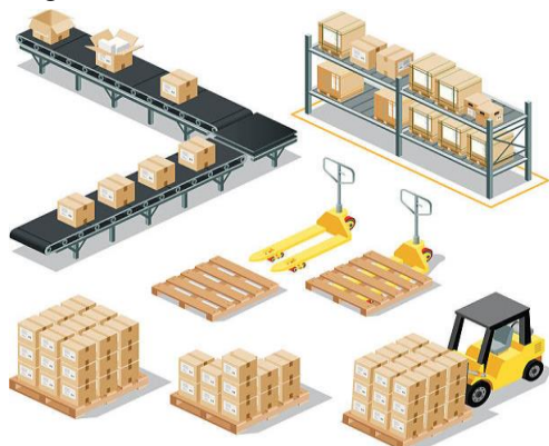
Slika 1. Prikaz skladišne opreme [5]

Adekvatna skladišna oprema neophodna je da skladišta obavljaju svoje poslove funkcije. Prilikom izbora opreme koja će se koristiti unutar skladišta, potrebno je voditi računa o karakteristikama i količini robe za skladištenje, prostor magacina kao i raspored prostorija u cilju kako bi se osiguralo da se posao može obavljati efikasno i ekonomično. Kvalitetna organizacija opreme u okviru skladišnog prostora, u toku izvođenja ostvaruju se uštede vremena i prostora skladištenja, bilo da se radi o prijemu robe, rukovanju, skladištenju ili izdavanju robe. Korišćenjem adekvatno odabrane opreme neće se postići samo maksimalna efikasnost i produktivnost, ali će unutrašnjost skladišta biti očuvana. Pored toga, oprema može biti u više varijacija, u zavisnosti od potreba određenog skladišta [4].