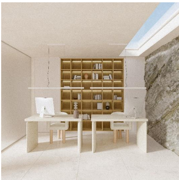
Slika 5. Prikaz radne sobe

Za razliku od ostatka kuće, u spavaćim sobama je za pod izabrano drvo, zbog dodatne topline i udobnosti. Zidovi su tretirani isto, a nameštaj je takođe od drveta, toplih, zemljanih tonova.