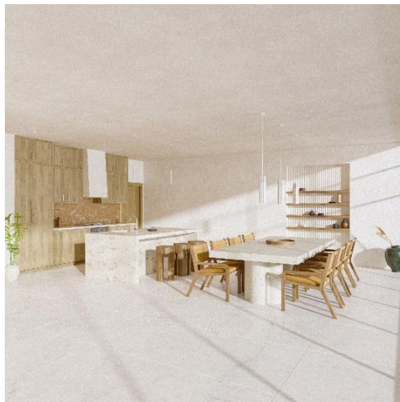
Slika 3. Prikaz kuhinje i trpezarije

Dnevna soba, trpezarija i kuhinja nalaze se u jednom velikom prostoru bez vizuelnih pregrada, ali projektovane tako da su jasno odvojene. Kuhinja je izrađena od rustičnog drveta, a u trpezariji i dnevnoj sobi se mogu videti teraco stolovi i kožni nameštaj. Dnevni boravak je kružno formiran, radi bolje socijalizacije korisnika i atmosfere, a dodat je i prostor za osamljivanje i uživanje u čitanju. Poseban kutak izdvojen je za „pauzu za pogled“, mesto gde se nalaze samo dve stolice i minimalistički sto, tako da ništa ne ometa pogled na more. Plava boja neba i mora stvara posebnu tenziju sa enterijerom navedenih prostorija.