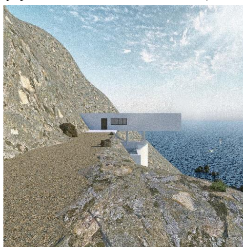
Slika 1. Prikaz prilaza objekta

Planinski predeo sa jedne, i širina mora sa druge strane kuće, dominantni su u odnosu na nju, te je objekat projektovan tako da ispoštuje prirodu i uklopi se u pejzaž, kao i da naglasi ovu dominantnost. On je umetnut između planine i mora tako da u isto vreme predstavlja granicu između njih, ali ih i spaja. Posmatrajući objekat sa obale, on se nazire i prožima između stena i vode poput belog šuma, pa je tako i dobio naziv „White noise“ (beli šum).