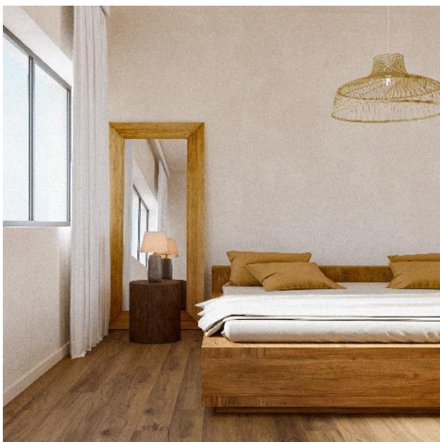
Slika 6. Prikaz spavaće sobe

Za razliku od ostatka kuće, u spavaćim sobama je za pod izabrano drvo, zbog dodatne topline i udobnosti. Zidovi su tretirani isto, a nameštaj je takođe od drveta, toplih, zemljanih tonova.