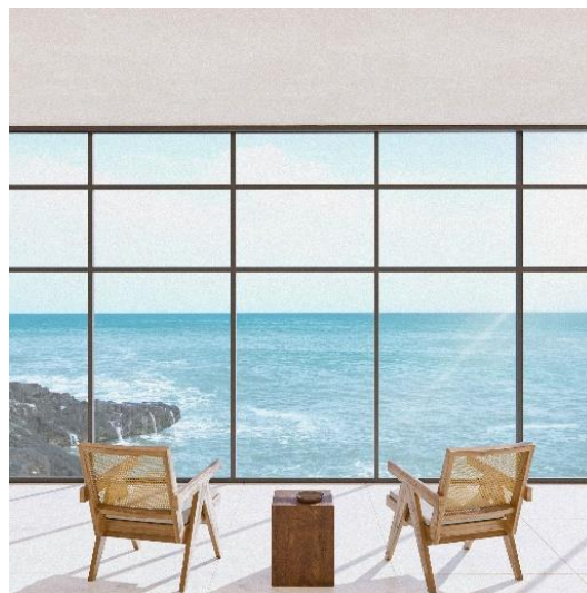
Slika 4. Prikaz mesta za pogled

Ostale prostorije su izdvojene, ali u komunikaciji sa ostatkom kuće preko mlečnog stakla. Na ovaj način je zadržana privatnost u sobama, ali je i propuštena prirodna svetlost. Poseban kontrast između nežnog mlečnog stakla i grubosti stene, javlja se u radnoj sobi.