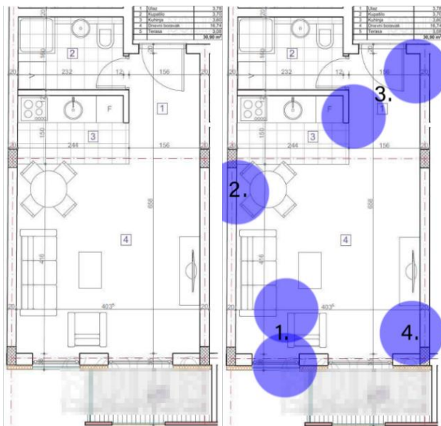
Slika 1a (levo) i 1b (desno). Osnova stana koji se koristi prilikom istraživanja (levo) i obeleženi nedostaci na njemu (desno)

U dnevnoj sobi (Slika 1b, br. 1) postoji problem kod otvaranja prozora/francuskog balkona, gde je on nameštajem zagrađen i nedostupan jer ne može da mu se priđe. U trpezariji (Slika 1b, br. 2) dve stolice su približene zidu, ne mogu da se izvuku i nije moguće sedenje na njima. Hodnik (Slika 1b, br. 3) zauzima veliku površinu, dok je kuhinja bez površine za rad. Takođe, TV komoda (Slika 1b, br. 4) može da bude proširena do zida terase i postane delom garderober, kako prostor za odlaganje odeće nije isplaniran.