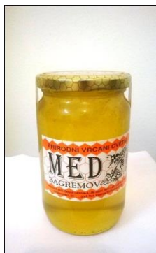
Slika 2. Med od čistog bagrema