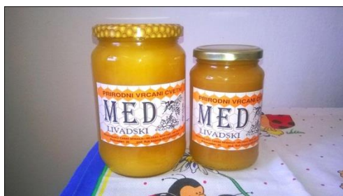
Slika 1. Prolećni i letnji livadski med

U nastavku sledi izgled proizvoda na slikama 1,2,3 i 4.