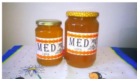
Slika 3. Lipov i šumski med.