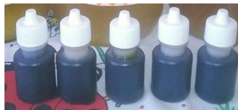
Slika 4. Propolis kapi