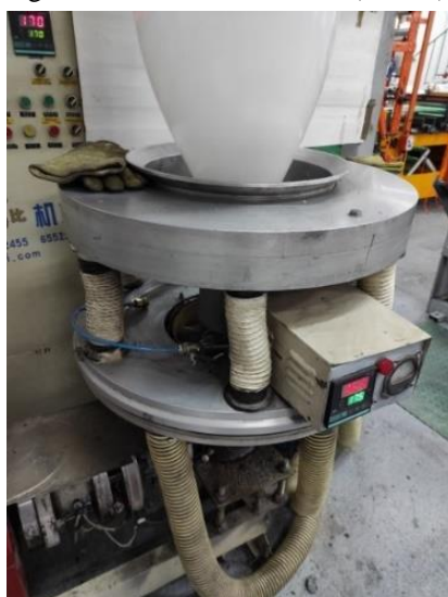
Slika 3. Glava ekstrudera sa ekstrudovanom masom

Folija se proizvodi na mašini za duvanje filma sa rotacionom glavom TECOM Ekstruder (slika 3).