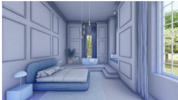
Slika 5: Plava soba – tip 1

podrazumeva prostore velikih dimenzija, najbolje rešenje jesu modularni komadi nameštaja. Izabrana sofa nosi naziv Bellini Modular Sofa ili Camaleonda i delo je italijanskog arhitekta i dizajnera Maria Belinija. Stolica korišćena za dizajn restorana je komad studija ADM iz Brazila sa nazivom Paloma , koji odiše elegancijom i kreativnošću. Oba komada nude mnoštvo kombinacija, pružajući veliki izbor boja i materijala.