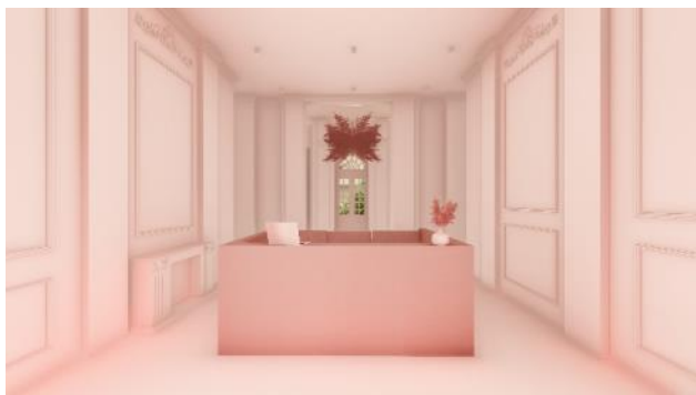
Slika 3: Prostorni prikaz – recepcija

Osvetljenje ovakvog tipa prostora je od posebnog značaja i zahteva funkcionalnu ulogu rasvete. Svetlosni efekti mogu potpuno promeniti doživljaj prostora i doprineti prenošenju jedinstvenog identiteta, izazivajući iskrene emocije kod korisnika. Kako bi se stvorila prijatna, topla i umirujuća atmosfera, kroz ceo prostor se koristi kombinacija ambijentalnog i akcentovanog osvetljenja u toplijim nijansama. Ambijentalno osvetljenje se javlja u vidu nadgradnih spotova, dok je akcentovano ostvareno pomoću visilica loptastih motiva, podnih i stonih lampi koje naglašavaju određene elemente enterijera.