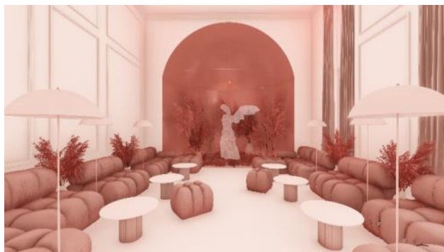
Slika 4: Prostorni prikaz - bar

Kao novi lejer u enterijeru, mobilijar odiše savremenošću, sa minimalističkom notom i sofisticiranim izgledom. Uzimajući u obzir da se radi o klasičnoj građevini, koja