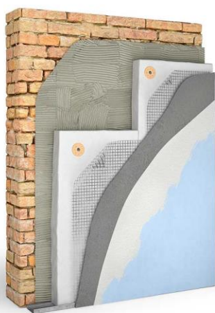
Slika 2. Izgled kontaktne ( demit) fasade

Poslednjih godina sve češće se koristi kamena vuna kao izolacioni materijal, jer ima brojne prednosti nad stiroporom, ali i višu cenu. U te prednosti spada odlična zvučna izolacija, negorivost kao i bolji efekat difuzije vodene pare tako da će objekat sa fasadom od kamene vune da “diše”.