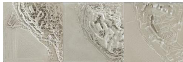
Slika 6. Rezultati prve test štampe

U prvom testiranju štampani su uzorci originalnog modela dobijenog prvim pristupom modelovanja i njegove remesh -ovane varijacije, kao i uzorak modela dobijen trećim pristupom modelovanja, ali sa ravnim terenom. Debljina sloja postavljena je na 0.2mm, a brzina kretanja štampanja na 50mm/s.