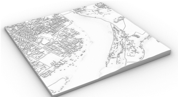
Slika 3. Rezultati dobijeni primenom trećeg pristupa modelovanja

Kako su ove linije generisane u ravni, prvi korak za dobijanje odgovarajuće geometrije bio je projiciranje linija na površ terena. U slučaju izrade zgrada projiciranje je izvršeno na njihovu najnižu tačku terena ispod, nakon čega su opcijom extrude dobijani solidi. U slučaju puteva, projiciranim linijama najpre je dodata debljina, nakon čega je ovakva geometrija oduzeta od geometrije terena.