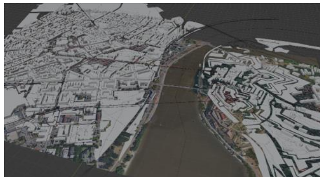
Slika 2. Rezultati dobijeni primenom drugog pristupa modelovanja

Drugi pristup obuhvatao je upotrebu Blender softvera i BlenderGIS dodatka. BlenderGIS dodatak pruža mogućnost interpretacije GIS podataka direktno u Blender softveru. Ovakav pristup obuhvatao je izdvajanje dela mape izabranog područja grada na osnovu koje se u softveru vrši dalje iščitavanje podataka o zgradama, putevima, železnicama, vodenim tokovima, mostovima i zelenim površinama.