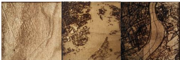
Slika 4. Rezultati prva tri testiranja laserskog graviranja

Za potrebe testiranja laserskog graviranja korišćen je digitalni model dobijen trećim pristupom modelovanja i njegove varijacije. Ova testiranja obuhvatala su, uglavnom, primenu rasterskog graviranja, koje zahteva postojanje slike na osnovu koje bi se radila gravura. Shodno tome, na osnovu digitalnog modela generisana je njegova dubinska mapa. Ovaj deo testiranja sadržao se od primene 4 različita pristupa laserskom graviranju, dok nije pronađen najefikasniji pristup.