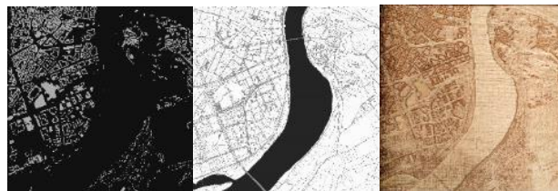
Slika 5. Slojevi korišćeni u četvrtom pristupu i njegov rezultat

ugravirane zgrade, a zatim u drugom sloju vektorski su ugravirani putevi i reka. Ovaj pristup nije se pokazao efikasno ni po pitanju kvaliteta finalnog modela, ni po pitanju vremena izrade. Ideja sa razdvajanjem slojeva, na sloj zgrada i sloj puteva i reke zadržana je i u četvrtom testiranju, s tim da su u ovom slučaju svi slojevi gravirani rasterski.