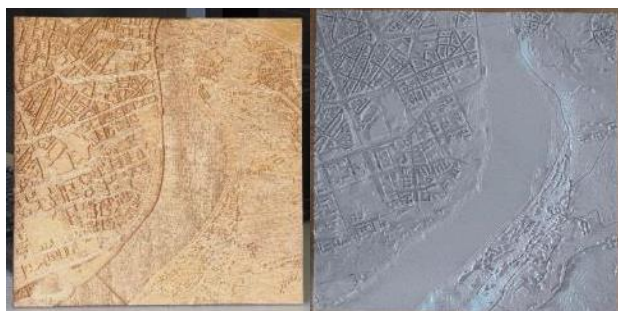
Slika 8. Rezultati fabrikacije - Fizički modeli u razmeri 1:15000

Najefikasniji pristup u pogledu laserskog graviranja i 3d štampe, primenjen je na izradi fizičkih modela dimenzija 20x20cm, razmere 1:15000.