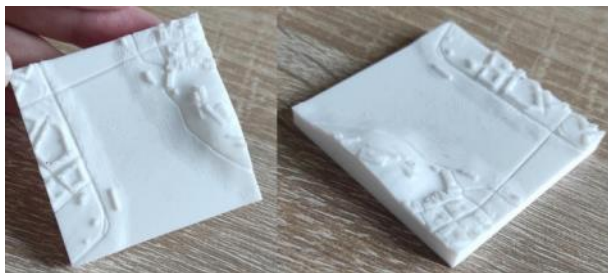
Slika 7. Rezultati štampe sa finijim podešavanjima

nivo zaglađenosti površine je moguće dobiti. U skladu sa tim, debljina sloja postavljena je na 0.06mm.