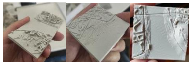
Slika 6. Rezultati druge test štampe

U sledećem testiranju korišćene su tri varijacije modela dobijenog trećim pristupom modelovanja, sa reljefom i to: model sa visokim zgradama i ispučenim putevima, model sa niskim zgradama i udubljenim putevima. Parametri debljine sloja i brzine kretanja štampanja bili su isti kao i u prethodnom testiranju.