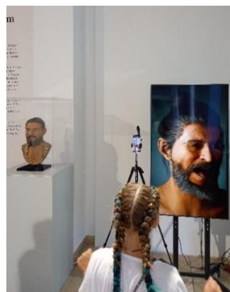
Slika 6. Interakcija pomoću MetaHuman tehnologije

Na samom ulazu prikazana je skulptura rekonstrukcije praistorijskog čoveka koji je živio pre 10 000 godina. Odmah pored skulpture, prisutan je i interaktivni deo izložbe, odnosno, veliki ekran na kojem je prikazan pračovek kao interaktivni digitalni čovek. MetaHuman tehnologija je omogućila konverziju 3D lica u digitalnog čoveka sa uverljivim facijalnim ekspresijama, osobinama ljudske kože i realističnom kosom. Kod eksponata pračoveka, potrebno je da posetilac stane ispred ekrana, a zatim kamera njegove pokrete i facijalne ekspresije prenosi na pračoveka.