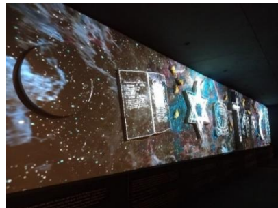
Slika 5. “Kalendar kruga promena” – Laserska projekcija

optičkim iluzijama, praćena 3D zvučnim šumovima, animiranim celinama, neočekivanim kretnjama. Virtuelne ljudske figure u pokretu su smeštene u prostoru, aparati koji zvone analognim zvukom mešaju se sa digitalnim zvukom okoline i samom zvučnom bojom govore o protoku vremena. Ova izložba je multimedijalna, koristi nove tehnologije, skulpturu, mapiranu 3D sliku, hologram, digitalni zvuk itd.