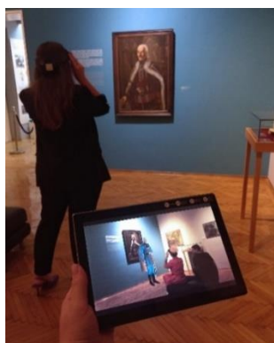
Slika 8. Prikaz na aplikaciji

Kod dečje verzije kreiran je karakter pčelice, koja prezentuje na jednostavan i zanimljiv način. Za decu birana su umetnička dela rađena različitim tehnikama, kako bi im se šire objasnio pojam umetnosti.