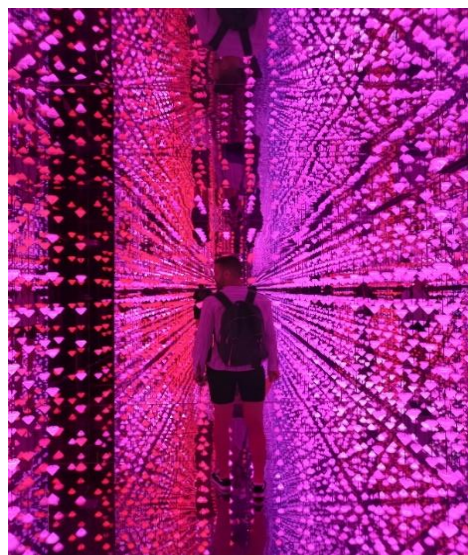
Slika 2. Studio Irma, Diamond Matrix, 2020

Studio Irma pomoću digitalnih tehnologija, kroz prostor, boju, pokret i aktivnog učesnika povezuje čovečanstvo. Diamond Matrix je instalacija kreirana od strane Studio Irma, koji je nastao 2020. godine, a osnivač je Irma de Vries.