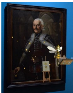
Slika 9. Prikaz uz HoloLens naočare