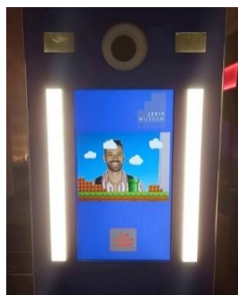
Slika 4. Izrađivanje suvenir fotografije