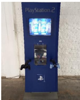
Slika 3. Sony Playstation 2

U muzeju prisutna su i različita izdanja Sega, Sony Playstation, Nintendo, Xbox i Wii konzola. Neki uređaji su slobodni za upotrebu i interakciju sa posetiocem, dok su neka izdanja samo izložena radi prikaza evolucije uređaja kroz godine. Na samom kraju izložbe, postavljen je uređaj na kojem posetilac može napraviti fotografiju u odabranom okruženju inspirisanim video igrama, na primer Super Mario, nakon čega se fotografija odštampa kao suvenir.