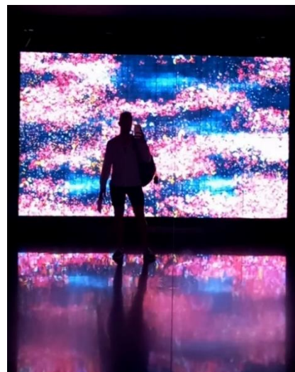
Slika 1. Multimedijalno okruženje "Flowers and People"

TeamLab je međunarodna, interdisciplinarna grupa stručnjaka kao što su umetnici, inženjeri, programeri, matematičari i arhitekti – čija dela predstavljaju kombinaciju umetnosti, nauke, tehnologije i prirode. Jedan od ključnih delova izložbe u Moco muzeju jeste njihovo delo "Flowers and People".