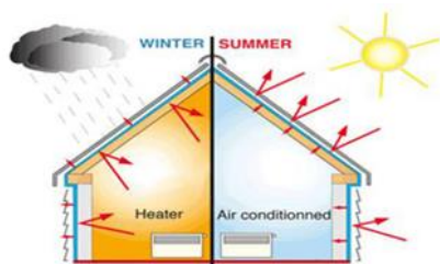
Slika 1. Funkcija toplotne izolacije objekta [7]

Toplotna izolacija je materijal ili kombinacija materijala koji usporavaju brzinu toplotnog toka kondukcijom, konvekcijom i zračenjem, što usporava protok toplote u ili iz zgrade zbog visokog toplotnog otpora. Ona daje glavni doprinos i predstavlja logičan prvi korak ka postizanju veće energetske efikasnosti.