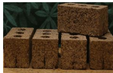
Slika 2. Blokovi od industrijske konoplje za termoizolaciju objekata [9]