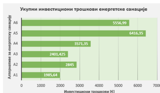
Slika 4. Trošak energetske sanacije po alternativama

Rezultati proračuna troška energetske sanacije analiziranog stambenog objekta po alternativama, prikazani su grafički na Slici 4, dok su na Slici 5 prikazani rezultati tehničke analize, kojom je utvrđeno da bi primenom Alternative 5 bila ostvarena najveća ušteda godišnje specifične energije za grejanje, te da bi se energetskom sanacijom dostigao D energetski razred objekta.