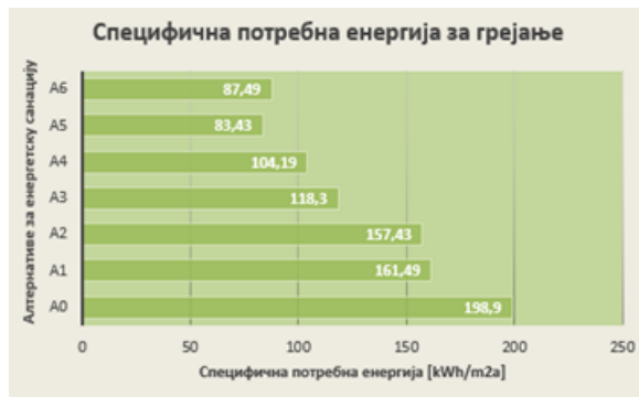
Slika 5. Specifična en. potrebna za grejanje prilikom primene različitih alternativa en. sanacije

Ipak, vrednost investicionih troškova energetske sanacije, kao ni specifična energija potrebna za grejanje objekta, ponaosob nisu pogodni indikatori u postupku izbora najoptimalnije alternative. Iz tog razloga, uveden je kriterijum koji u sebi inkorporira oba pokazatelja. Na taj način moguće je odrediti koeficijent energetske sanacije koji bi predstavljao relativni pokazatelj uštede energije po svakoj uloženoj novčanoj jedinici. Koeficijent energetske sanacije moguće je odrediti uz pomoć jednačine: