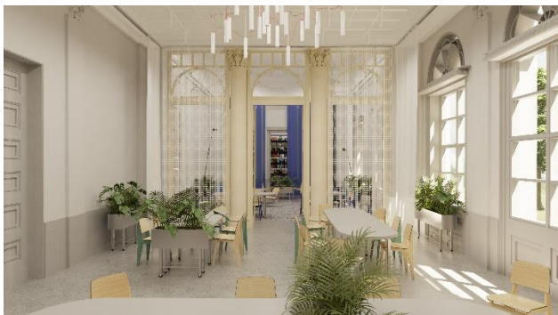
Slika 2. Vizualizacija multifunkcionalne zone

Osvetljenje multifunkcionalne zone je od posebnog značaja za ceo enterijer. Kako je taj prostor poprilično prostran u, bilo je neophodno nekako umanjiti taj osećaj iznimne beskonačnosti. To je rešeno smišljanjem šinskog sistema sastavljenog od linijskih elemenata (aluminijumskih kutijastih profila) koji su međusobno ukrštani unapred definisanim rasterom. U ostatku enterijera, korišćena je kombinacija akcentovanog i ambijentalnog osvetljenja. Ambijentalna rasveta prisutna je u vidu visilica i podnih lampi dok je akcentovana uperena na površine za rad u vidu visećih lampi. Neki od brendova čiji su elementi mobilijara i rasvete korišćeni pri projektovanju enterijera su Magis, Artek, Hay, Fritz Hansen, Flos, Davide Groppi, Vibia, itd.