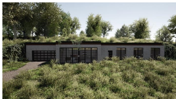
Slika 2: Grafički prikaz stambenog objekta na lokalitetu

- Na samom posedu planiran je i prirodan bazen koji bi se snabdevao vodom iz izvora na parceli i koji je podeljen u 2 segmenta: jedan deo služi za filtraciju sa biljnim vrstama koje omogućavaju čišćenje vode iz izvora, a drugi deo za kupanje i rekreaciju korisnika. Višak vode se iz bazena sprovodi pumpama za navodnjavanje useva, voćnjaka i vinograda na posedu, kao i celokupna iskorišćena voda iz objekata.