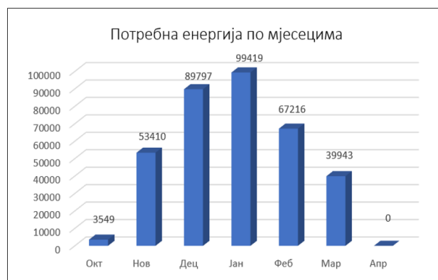
Slika 5. Potrebna energija za zagrijavanje postojećeg i saniranog objekta