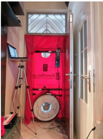
Slika 2. Blower door

gradnje kada su zidovi omalterisani, fasadna stolarija ugrađena, instalacije razvedene oprema za merenje se instalira na ulaznim vratima. Na slici 2 prikazana je postavljena oprema spremna za mjerenje. Mjerenje se vrši na osnovu razlike u pritiscima, najprije se napravi podpritisak u zgradi od 50Pa a potom nadpritisak od 50Pa. Po dostizanju određenog pritiska mjeri se količina vazduha koja je neophodna za održavanje tog pritiska. Ta količina vazduha koja se uduva u prostor izađe nekontrolisano kroz šupljine u objektu (npr. na spojevima konstrukcije za prozorima i vratima). Sva „slaba“ mjesta na kojima vazduh izlazi iz objekta treba sanirati, zatvoriti zaptivnim trakama, folijama i sl [2].