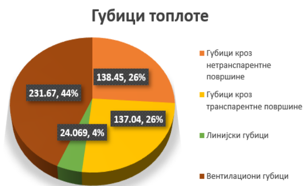
Slika 3. Gubici toplote na postojećem objektu

Proračunom je dobijena ukupna potrebna energija za grijanje za slučaj sistema koji radi bez prekida, kao i po mjesecima. Na osnovu sprovedenog proračuna, objekat je svrstan u energetske razred „E“.