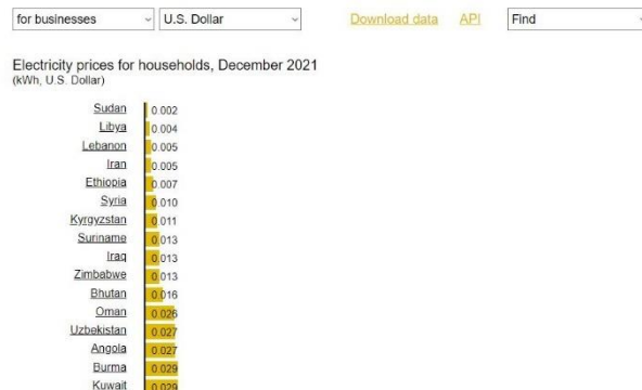
Slika 3. Globalne cene električne energije svih država na svetu po kWh iz 2021 godine

Cena struje je drugačija za svaku državu, a podaci koji su uzeti u proračunu isplativosti korišćeni su iz literature 4.