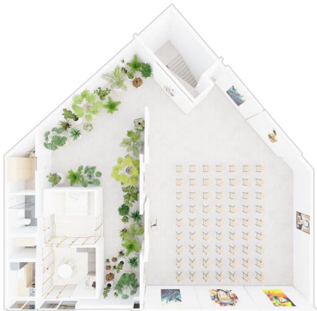
Слика 4. Други пример могуће поделе простора

Други пример: Слика 4, Такође подела на приватни и радни простор осим што је радни простор у функцији полу јавног. На пример држање презентација или предавања. Зеленило се као и у претходном примеру користи као наговештај да иза панела постоји још нешто, мада се приватни простор у сваком тренутку може потпуно визуелно „изоловати” панелима.