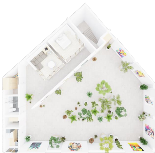
Слика 6. Трећи пример могуће поделе простора

Пример четврти: Слика 6, такође изложба мада би се сада могло рећи и галерија јер се приватни простор потпуно потискује. Панели и зеленило се користе као део изложбе и као преграде које спречавају улаз у кубусе.