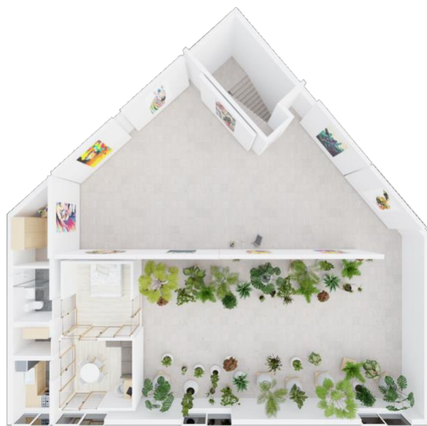
Слика 3. Први пример могуће поделе простора

Први пример: Слика 3, јасна подела на приватни и радни простор. Уметнички панели се користе у функцији преградних зидова и према претходно наведеним примерима тежи се једнакости између ова два простора.