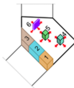
Дијаграм просторне организације: