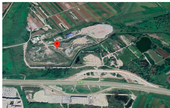
Slika 2. Lokacija uzorkovanja na deponiji komunalnog otpada u Novom Sadu

Uzorkovanje je sprovedeno na nesanitarnoj deponiji u Novom Sadu. Uzorci procedne vode su kolektovani sa tri lokaliteta (dva obodna kanala i laguna).