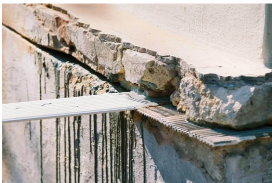
Slika 3. HIO tehnologija [8]

HIO tehnologija spada u tehniku koja predstavlja trajnu zaštitu od kapilarne vlage, i postupak se sastoji od obijanja maltera, bušenja rupa i presecanja zida, čišćenja reza, ubrzgavanje injekcione mase pomoću pumpe visokog pritiska a zatim utiskivanje šina u svežu injekcionu masu u rezu (slika 3).