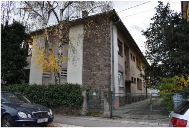
Slika 5. Izgled objekta sa severo-zapadne strane.