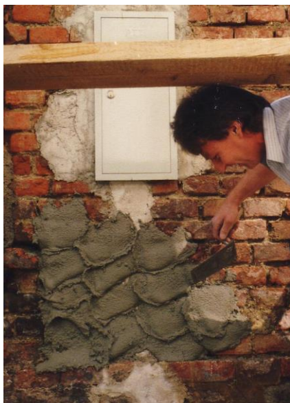
Slika 4. Nanošenje paropropusnog maltera [1]

Nakon sušenja grubog sloja nanosi se fini sloj materijala, na navlažen grubi sloj, u sloju od 3-5mm, nakon čega se perdaši (slika 4).