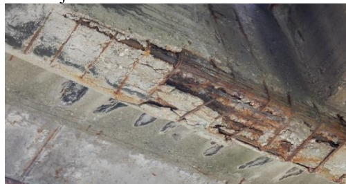
Slika 1 - Otpadanje zaštitnog sloja betona usled korozije

Zaštitni sloj betona je ključan kako bi se armaturni čelik zaštitio od korozije nastale uticajima iz spoljašnje sredine. Kada čelična armatura nije pravilno postavljena ili zaštićena od okoline, ona će početi da korodira usled oksidacije. Kao posledica dejstva korozije dolazi do bubrenja čelika, pojave unutrašnjeg naprezanja na zatezanje, koje, ako prekorači čvrstoću betona na zatezanje, dovodi do pojave pukotina i ljuštenja u zaštitnom sloju - Slika 1.