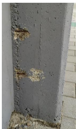
Slika 3 – Površinska korozija poprečne armature uz otpadanje zaštitnog sloja betona

Vizuelnim pregledom detektovan je veliki broj defekata koji potiču iz perioda građenja objekta (mala debljina zaštitnog sloja betona, linijska segregacija na mjestima spojeva oplata, betonska gnijezda, geometriske imperfekcije, nepravilno izvedeni prekidi betoniranja i rupičasta površina usled zarobljenih mehurića vazduha u oplati) i oštećenja koja su se razvila usled višegodišnje izloženosti objekta atmosferilijama i usled nabrojanih defekata (korozija armature, mehanička oštećenja rastvaranje i ispiranje \text{Ca}(\text{OH})_2 , prsline i biološka korozija). Na narednim slikama su ilustrovani ovi defekti i oštećenja.