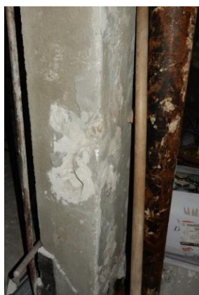
Slika 4 – Lokalno mehaničko oštećenje maltera i betona duž ivice unutrašnjeg stuba