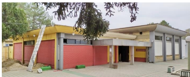
Slika 2 – Postojeće stanje objekta

mešoviti sa AB stubovima i zidanim fasadnim zidovima. AB međuspratna (krovnna) ploča je debljine 10cm. Objekat je fundiran na plitkim temeljima.