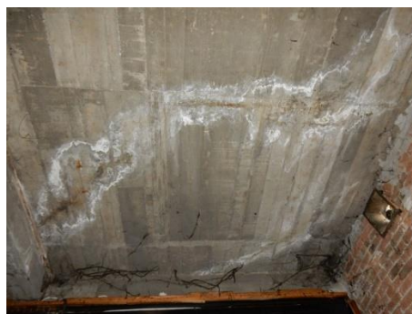
Slika 6 – Poprečna i kose pukotine u ploči sa tragovima procurivanja, bele mrlje od naslaga \text{CaCO}_3 , mestimično vidljiva korodirala armatura