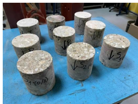
Slika 7 – Betonski cilindri pripremljeni za ispitivanje čvrstoće pri pritisku

Radi utvrđivanja čvrstoće pri pritisku betona ugrađenog u osnovne elemente noseće konstrukcije, izvađeno je 9 betonskih jezgara, po 3 jezgra iz ploče iznad prizemlja (P1, P2, P3), stubova prizemlja (S1, S2, S3) i temelja samca (T1, T2, T3) - Slika 7.