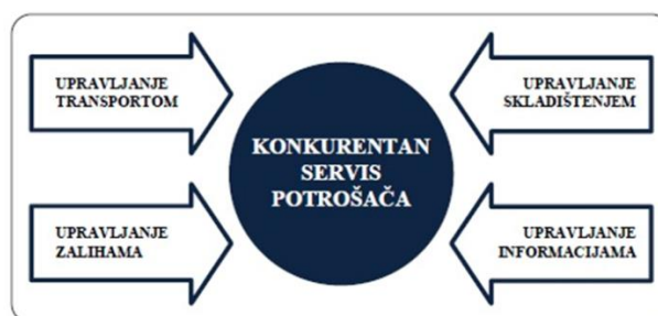
Слика 1. Четири подсистема логистичког менаџмента и крајњи логистички циљ [2]

а затим у индустрији [1]. Управљање логистиком подразумева координацију са четири основна подсистема (транспорт, залихе, складиштење и информације) а њихова оптимизација води оптимизацији потрошача, и тај однос је приказан на слици 1.