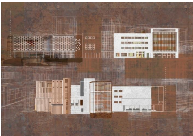
Slika 4. Razvijeni frontalni i dvorišni izgled

Osposobljavanje krova; Proširenje kapaciteta podruma; Prilagođavanje fasade novoprojektovanim funkcijama. Predviđena materijalizacija fasade je natur beton u kombinaciji sa kortenom na pojedinim mestima (Slika 3). Aluminijum je predviđen za sistem vertikalnih brisoleja, presvučen klondike kortenom. Karakteristična fasada Studija M (staklena zid zavesa sa podelama) je očuvana, prilagođena novim energetske standardima. Forma i materijali koji su koje je arhitekta Žilnik predvideo, ostaju isti. Predloženo je da se crveni zid sa prozorčićima pri ulazu obloži kortenom, zbog trajnosti rešenja, uz naglašavanje značaja ovog elementa specifičnom estetikom rđe.