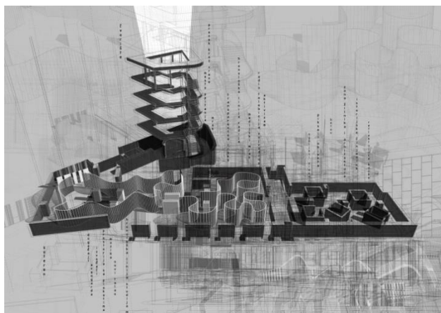
Slika 3. Šematski prikaz podruma i čvorišta

Pokretač društva je aktivizam, on počiva na ličnom odnosu sa objektom. Naš zadatak je da ga probudimo, tako što ćemo u programsku fuziju uključiti i sećanje na Studio M nekad i njegov značaj. Ideja je bila stvoriti mesto nove misli, misli koja je promenljiva u toku vremena. Mesto odakle potiče promocija kulture grada. U objektu se sukobljava klasičan tip programa sa sajt - specifik muzejom, koji predstavlja prostorni aktivizam. Storytelling objekta započinje iz samog podzemlja, u kojem nastaje sajt-specifik koncept, koji se dalje linearno rasprostire kroz ceo objekat, sa kulminacijom na krovu, odakle posetioci imaju pogled na grad. Polazeći od podrumskog dela objekta posetilac prolazi kroz filter istorije Studija i Radija, da bi se kasnije susreo sa daljim stvaralaštvom u objektu koje se dešava u sadašnjosti.