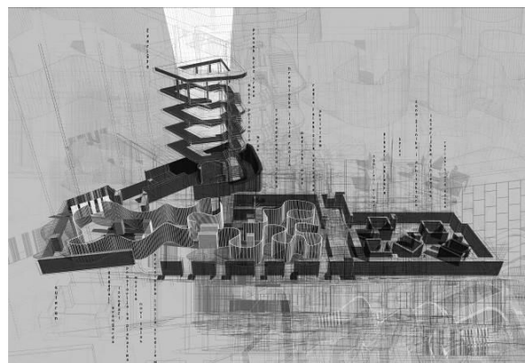
Slika 3. Izložbena postavka u podzemnoj etaži

Podzemna etaža je nosioc sajt-spesifik programa u objektu, sa izložbenom postavkom o istorijatu, hronologiji objekta i arhitekti Studija M (Slika 3). U nižem segmentu je smeštena diskoteka, sa prostornim artefaktima iz objekta. Zbog potrebe što direktnije komunikacije između prizemlja i podruma, uvedeno je stepenište na uglu objekta, koje znatno menja prvobitni izgled fasade.