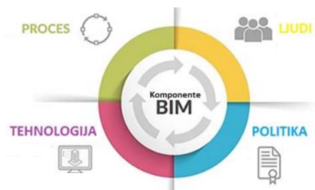
Slika 1. Glavna područja implementacije BIM-a [1]

BIM postupak odnosi se na četiri glavna područja (prikazano na Slici 1.) koja obuhvataju četiri jednaka dela: proces, ljude, tehnologiju i politiku.