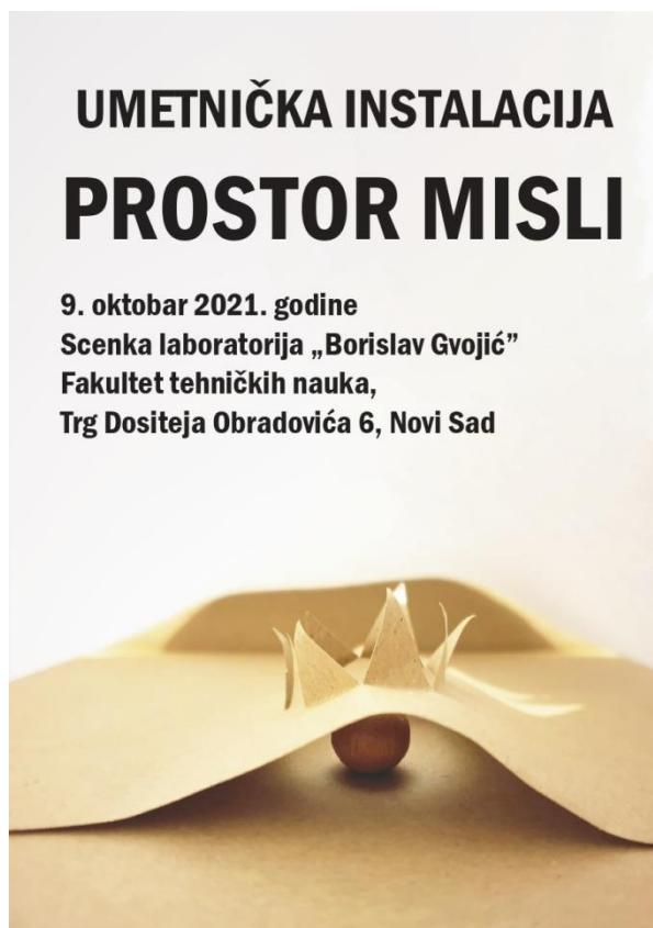
Slika 2 – Plakat i pozivnica za izložbu