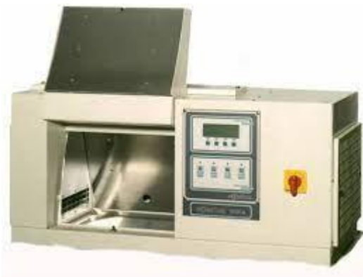
Slika 2. Solarbox 1500E [6]

Ubrzani proces starenja sproveden je u vremenskim intervalima od 72 i 144 sata kako bi se analizirao uticaj starenja na broj čestica i intervale površina čestica perlescentnih pigmentata u otisku. Za svaki perlescentni pigment otisci su podeljeni u tri grupe: neostareni (netretirani), ostareni 72 sata i ostareni 144 sata.