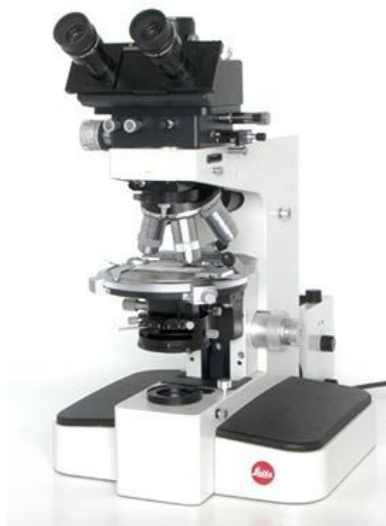
Slika 1. LEITZ-Orthoplan mikroskop [5]

Primenom ImageJ programa za analizu slika (verzija 1.52), mikrografske snimci dobijeni optičkim mikroskopom (LEITZ-Orthoplan, slika 1) su konvertovani u mikrografske fotografije otisaka odgovarajućih perlescentnih pigmenata. Takođe, ImageJ analizom su dobijeni sledeći parametri za čestice pigmenata: broj (N) čestica i intervali površina čestica perlescentnih pigmenata u otisku.